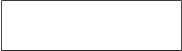
Photo du candidat Récente et très ressemblante En couleur 45 X 35 mm Fond clair et uniforme La photo doit couvrir le texte mais pas les bords du cadre.

↑ Ne rien écrire au-dessus de cette ligne (sauf la signature) ↑