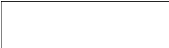
Foto van aanvrager Recent en heel gelijkend In kleur 45 X 35 mm Lichte egale achtergrond Foto moet tekst bedekken maar mag randen van kader niet bedekken

Niets boven deze lijn schrijven (behalve handtekening).